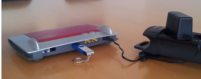
Abbildung 1: Fritzbox konfigurieren