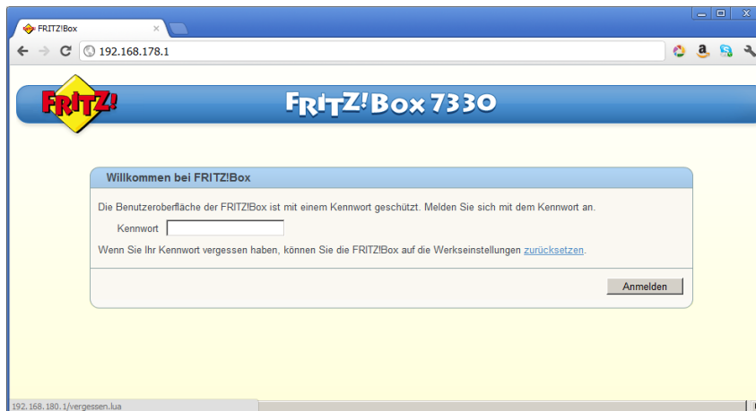
Abbildung 2: Fritzbox zurücksetzen - Schritt 1

Wurde die Fritzbox bereits konfiguriert, können Sie diese wieder in den Auslieferungszustand zurücksetzen.